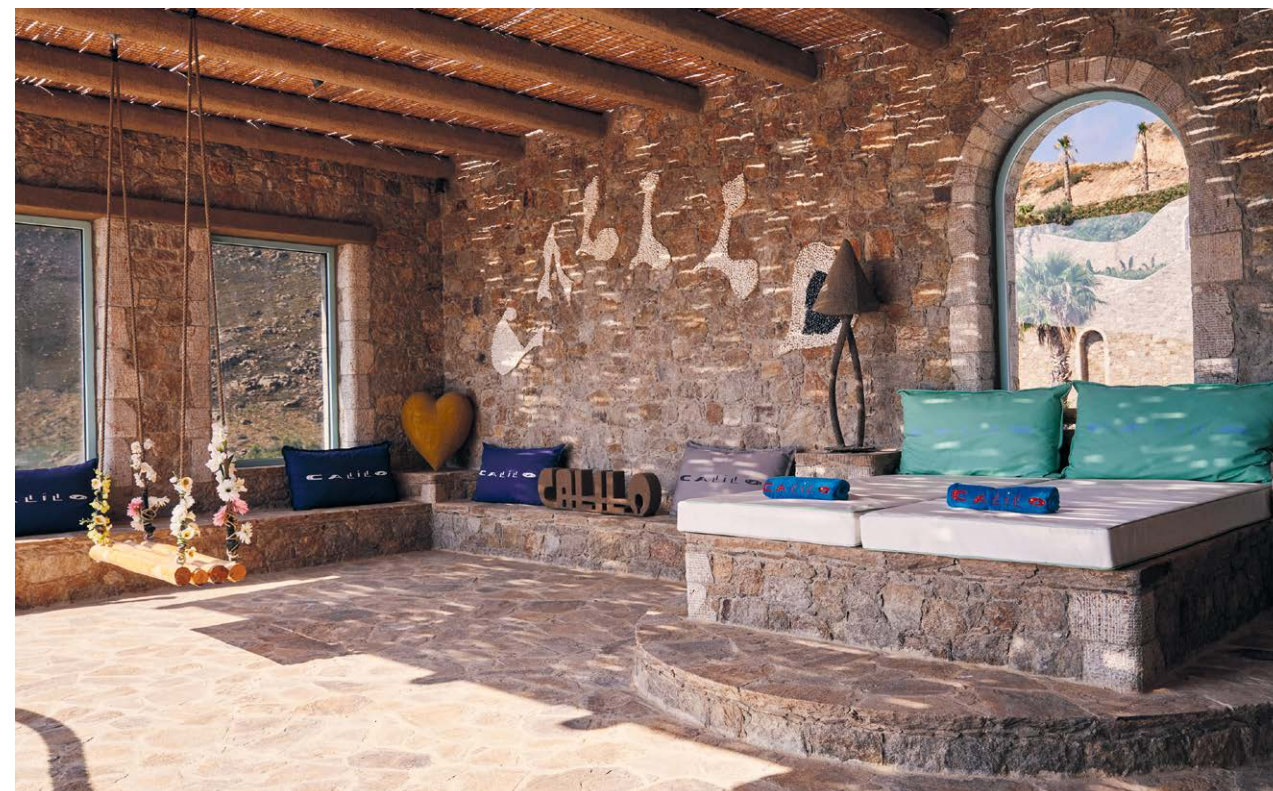
D. YANNI (9) - I. CAPEROCHIPI (11) - C. DRAZOS (DESTRA)